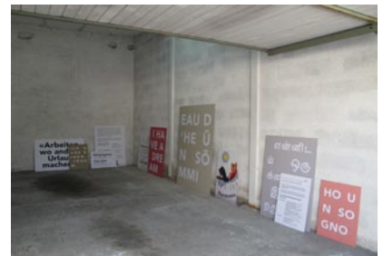
... Mit fremden Augen sehen, Kunstwege Pontresina Pontresina, 24.6.–19.10.2017